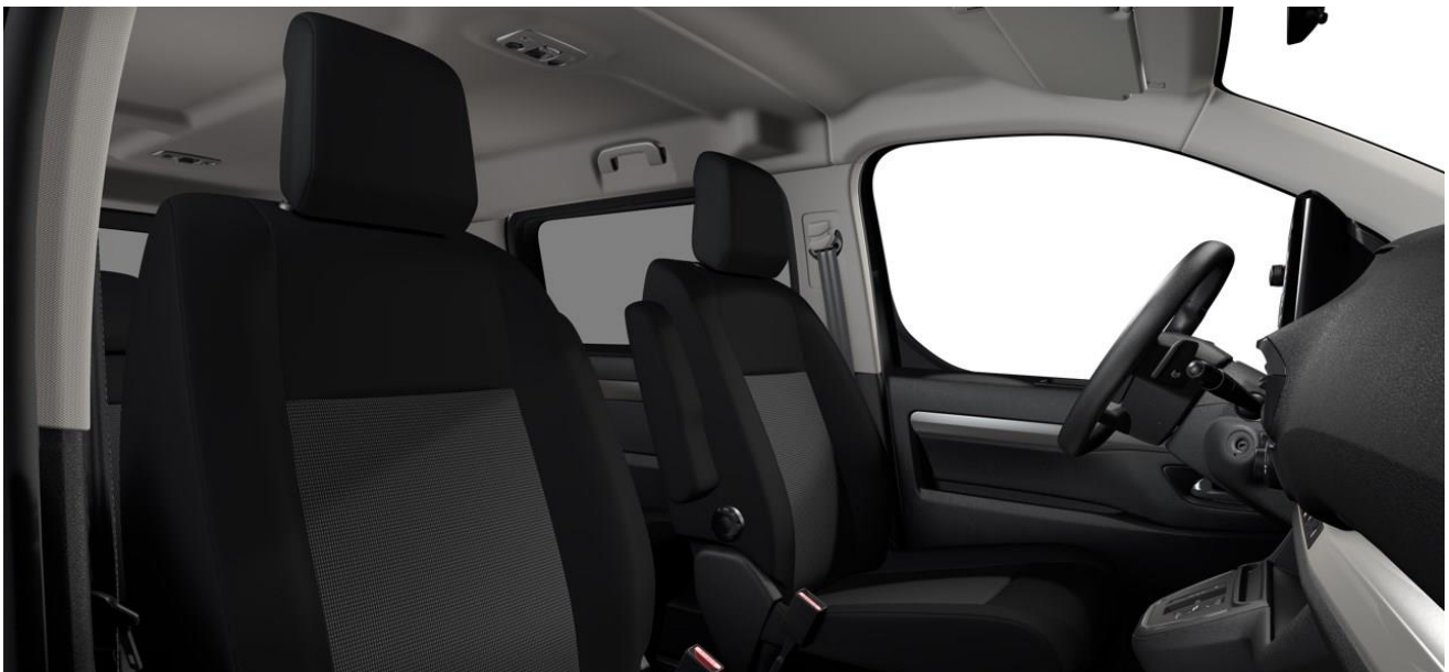
STOFF CURITIBA BLACK