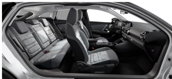
Ambiente Alcantara & Kunstleder GREY