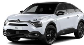
COLOR-PAKET "Turbo Grey"

- Airbump® und Stoßfänger vorne mit schwarzer Dekorurandung