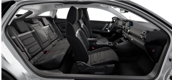
AMBIENTE HYPE BLACK