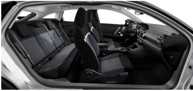
SERIENMÄSSIG STOFF "MEANWHILE"