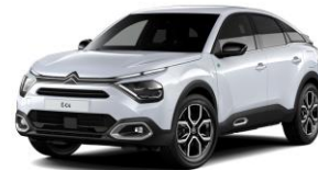
COLOR-PAKET "Glossy Silver"

- Airbump® und Stoßfänger vorne mit grauer Dekorurandung