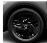
18-Zoll-Leichtmetallfelgen „AEROBLADE“ in Schwarz