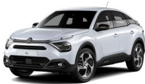
COLOR-PAKET "Glossy Black"

- Airbump® und Stoßfänger vorne mit schwarzer Dekorurandung