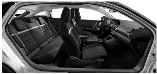
AMBIENTE URBAN GREY