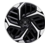
18-Zoll-Leichtmetallfelgen „AEROBLADE“ glanzgedreht